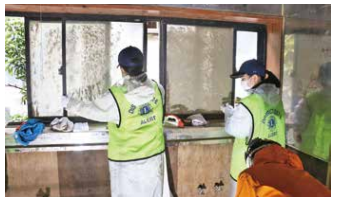
被災した家屋内の清掃を行う生徒

熊本県立熊本農業高校の2年生133人が2月26日、神瀬地域でボランティア活動を行いました。今回のボランティアは、平成ライオンズクラブ（熊本市）の親会とする熊農平成レオクラブとも連携し、さらに人吉球磨の会員を含むライオンズクラブ16人も参加しました。