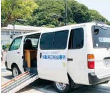
移動投票所のイメージ

① 移動期日前投票所の開設 再編により近くの投票所が無くなる投票区においては、移動が困難な方への配慮も必要ですので、移動投票所を開設し、投票機会の確保を図ります。