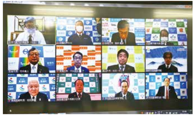
zoomミーティングで行われた協定式

恋人の聖地ネットワーク災害時相互応援協定の協定式が2月22日、zoomミーティングで行われました。この協定は大規模災害時、救援協力し、復旧を円滑に行うことを目的としています。今回の締結は趣旨に賛同した12市町村が締結しました。