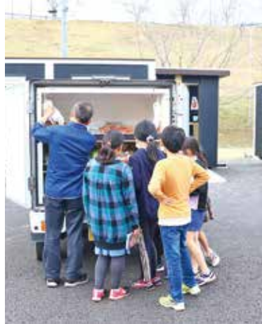
子どもも買い物に来ていました