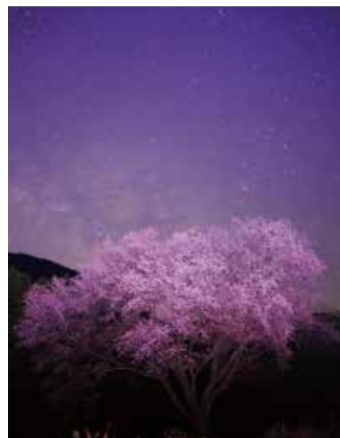
力強く咲いた毎床の大桜