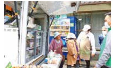
乳製品などもあります