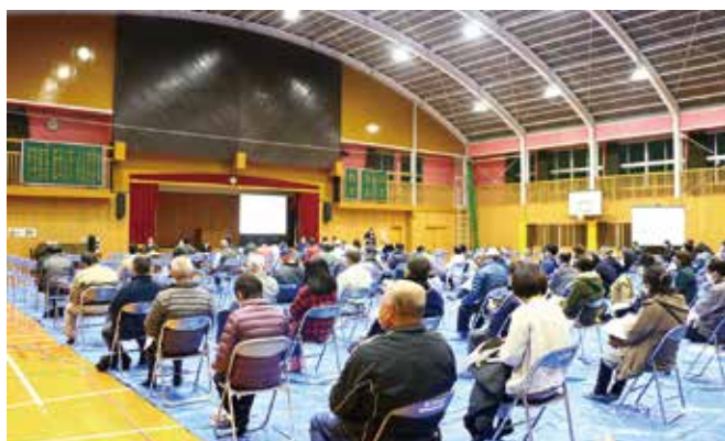
説明を聞く村民の皆さん

球磨川水系の治水対策について、国土交通省が3月12日、13日に一勝地小学校体育館で説明会を開催しました。球磨川流域の村民など延べ314人が出席しました。