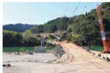
沖鶴橋の復旧の様子

いつか、お世話になった先生や地域の皆さんに大きくなった姿を見せられる時が来るといいですね。(野々原)