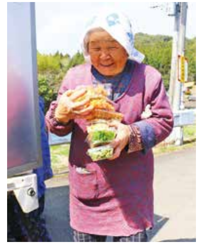
手にたくさん抱えています