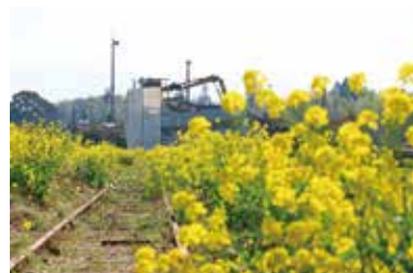
線路沿いに菜の花