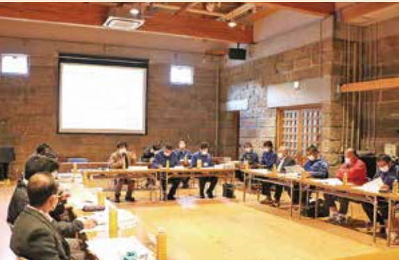
第2回復興計画策定委員会の様子

復興計画骨子案をもとに今後の村の将来について家族や班で話し合いをお願いします。また、年末年始にかけて第2回のアンケート調査を全世帯に実施する予定です。主な内容は今後の住まいに関する今の思いをお伺いします。また今後地域ごとの話し合いの場となる「地域別協議会」を立ち上げる予定です。村民の皆さんのご理解とご協力をお願いします。 問い合わせるさと創生課企画調整係 ☎（32）1114