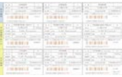
クーポン券のイメージ