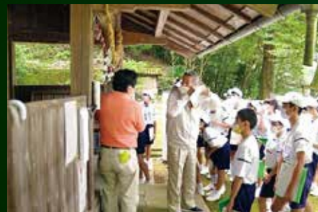
球磨村一周歴史の旅の様子

球磨村では、「学校を核とした地域づくり」を目指して地域と学校が相互にパートナーとして連携・協働して「地域学校協働活動」を推進しています。今月号から学校に関わる地域の皆さんにインタビューを行い、子どもたちへのメッセージを伺いました。