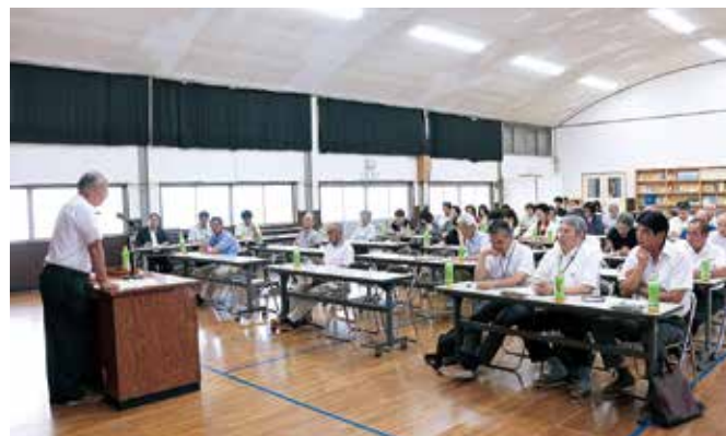
真剣に話を聞く参加者たち

講演では、新聞記事を活用して語学力を養成する「きよら塾」や、日本語教室「ことばのまなびや」などの自身の取り組みから「自分とともに、他の人の大切さを認めることが大切」などの話があり、関係者は人権への理解を深めました。