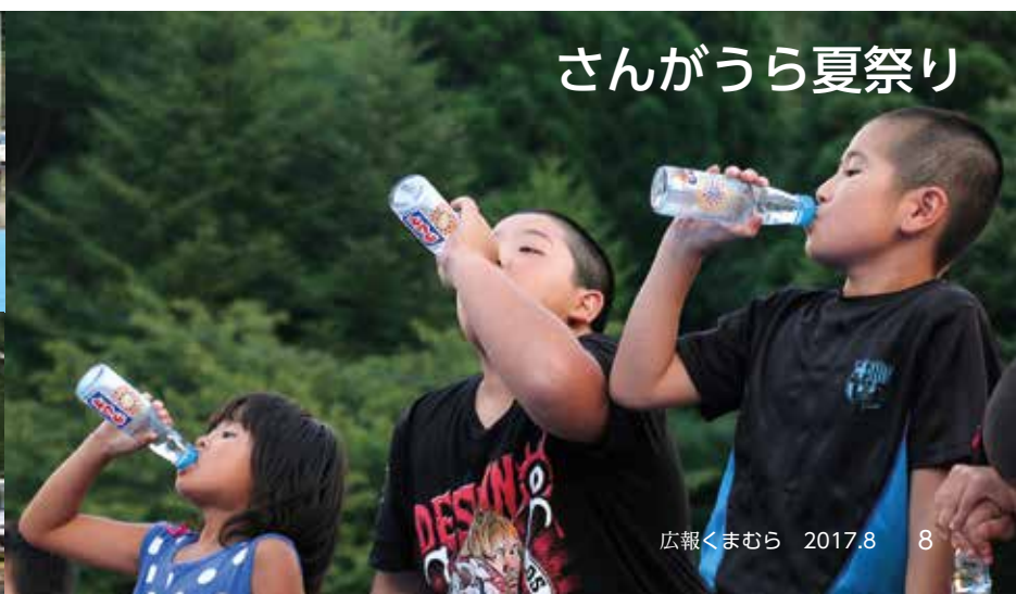
さんがうら夏祭り