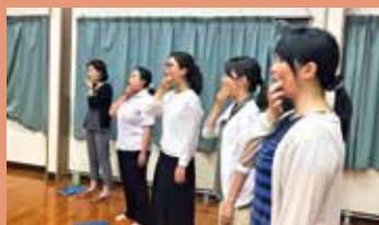
本番に向け鋭意練習中。乞うご期待

9月2日、3日の2日間、あさぎり町の須恵文化ホールで、人吉球磨の青年団が一堂に会し、球青協文化祭が開催されます。