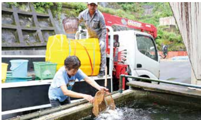
水槽に入れられる大きく育ったヤマメ

黒白地区のヤマメ養魚場で育てられたヤマメ 100 匹が 8 月 9 日、球泉洞に出荷されました。