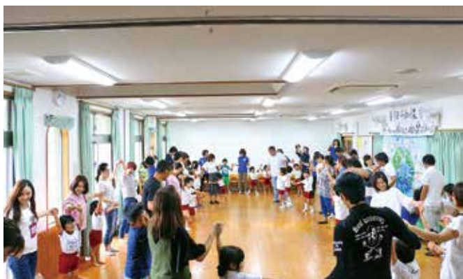
親子で手を繋ぎ、輪になって踊る参加者たち

1980年の長崎原爆忌から始まった平和保育が8月2日～5日までの4日間にわたり、渡保育園で開催され、同園の園児83人とその保護者が参加しました。