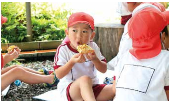
焼き立てピザをおいしそうに頬張る園児

「私たちのふるさととはっけん」をテーマに7月28日、渡保育園年長児15人と小学1年生から3年生までの渡学童クラブ12人が田舎の体験交流館さんがうらを訪れ、ピザ作りや野外活動などを楽しみました。