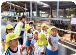
うしがいっぱいね〜

楽しみ半分、不安半分で迎えたお泊り保育。この経験を通し、心もからだも一段と大きく成長できたのではないかと思います。また、ことしも生まれ育った郷土の良さを発見するよい機会となりました。