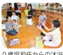
0歳児担任からの沐浴のアドバイス