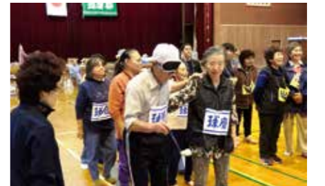
前が見えません。パートナーを信じて!!

10月27日、あさぎり町免田体育館において第45回球磨郡身体障害者福祉協議会連合会の体育祭が開催されました。今回は、5町村の協議会に、つづじヶ丘学園と第二つづじヶ丘学園の2チームが加わり、計7チームが参加。球磨村チームは、総合3位という好成績を収めました。体育祭終了後の昼食会では、焼酎で競技の疲れを癒す会員さんもいました。最後まで笑顔に包まれた楽しい大会となりました。