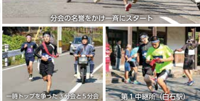
一時トップを争った3分会と5分会