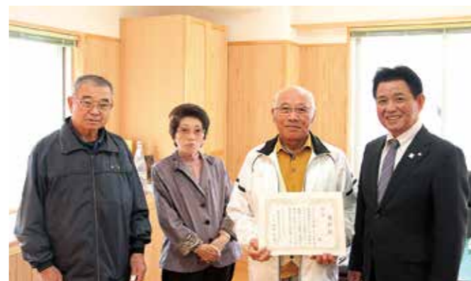
優勝した球磨村Cチーム(ミドリ会)の皆さん

郡老連のグラウンドゴルフ大会が10月19日、錦町民グラウンドで開催され、郡内各市町村の老人クラブから42チームが参加しました。本村からは、村の大会で上位に入賞した3チームがA～Cチームとして出場し、Cチーム(ミドリ会)が見事優勝を果たし、42チームの頂点に立ちました。