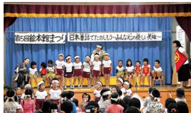
かわいらしい三太郎がいっぱい

第15回絵本館まつりが10月26日から29日までの4日間、渡保育園で開催され、渡保育園の園児や保護者などが参加しました。