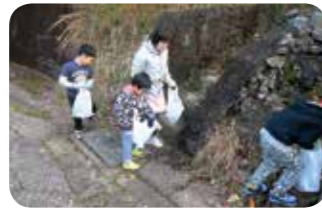
ごみ拾いもだけど、虫探しも気になる...