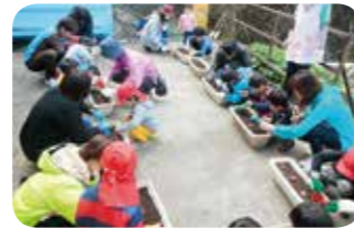
きれいなチューリップが咲きますように