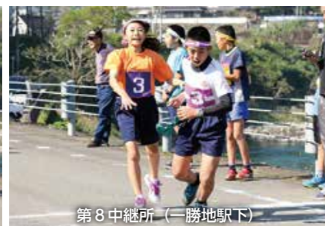
第8中継所 (一勝地駅下)