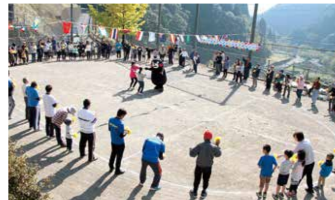
くまモンと「お誕生日仲間」を踊る参加者たち

第13回やまびこ運動会が11月13日、「がんばろう熊本！立野から元気を届けよう」をテーマに、旧渡小学校立野分校のグラウンドで開催され、立野地区内外から約120人が参加しました。