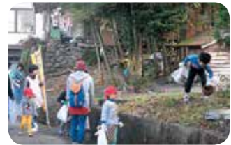
空き缶やお菓子のごみが落ちてるよ

小さい時から親子で取り組むことで仏教の教えにも通じるボランティア精神「日本をきれいにする（他の人が喜ぶことをする）心」を養っていかれたらと思います。今自分に出来ることを実践し、皆で協力し、きれいにする喜びを分かち合い、美しい球磨村を目指します。