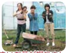
大きいお芋が掘れました！