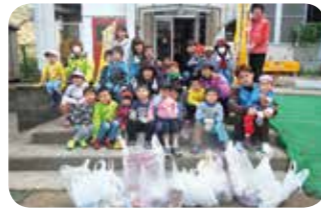
こんなにたくさんのごみを拾いました