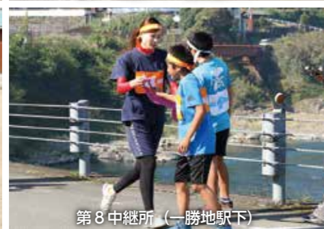
第8中継所 (一勝地駅下)