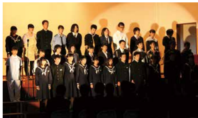
感動を与えた3年生の迫真の演技

球磨中学校の学習発表会と合唱コンクールが11月13日、球磨中学校体育館で開催されました。