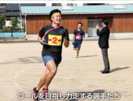
ゴールを目指し力走する選手たち