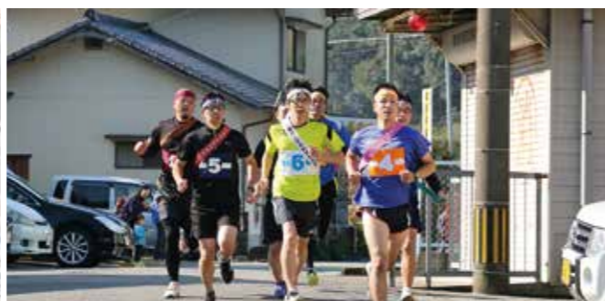
分会の名誉をかけ一斉にスタート