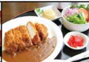
必勝! 森のカツカレー