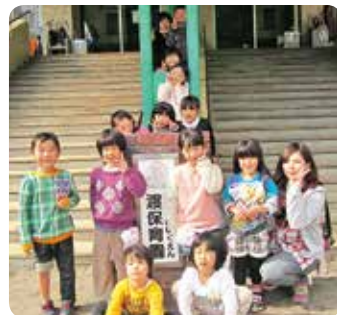
みんな元気で頑張ろうね!