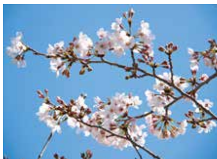
役場前のソメイヨシノ (3月22日撮影)

すっかり季節は春となりました。国道沿いのソメイヨシノやヤマザクラも、3月19日あたりから開花し始め、満開も近いようです。少しだけ山の中に入るとフキノトウやタラの芽が出てきています。これからはワラビやゼンマイなど、いろいろな山菜が豊富に取れる季節です。四季折々のいろんな魅力がある球磨村。あらためていいところだと思います。3月からは空き家バンク制度をスタート。村にはたくさん空き家があります。その空き家を活用してたくさんの方が移住してくれることを願います。そのためにしっかりと村の情報を発信していきたいと思っています。