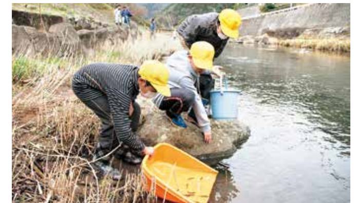
ヤマメの稚魚をやさしく放流する子どもたち

子どもたちは、持ち寄ったバケツやてみに体長5センチほどの稚魚を入れ、大きく元気に育つことを願いながら川に放ちました。体験した子どもたちからは「一匹でも多く大きく育ててほしい」「絶対に川にごみを捨てないようにしたい」などの感想が聞かれました。