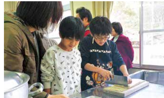
上手にそばを打つ子どもたち

松谷棚田で育ったそばを使ったそば打ち体験は3月13日、村内外から38人が参加し、田舎の体験交流館さんがうらで開催されました。