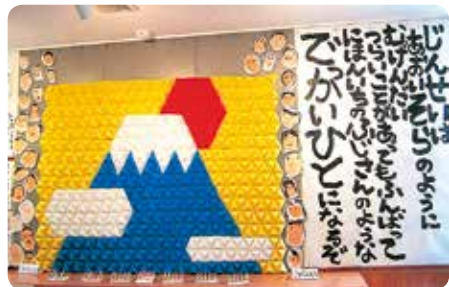
4、5歳児さんの合作。折り紙を672枚折って作り上げた日本一の富士山です

りでは「ジャックと豆の木」のジャックになりきって楽しい一週間を過ごしました。そして鳥肌が立つような感動を与えた「あまちゃん」の合奏。素晴らしかったです。このやる気満々の年長児さんは、期待に胸をふくらませ、渡小学校へ7人、一勝地小学校へ6人が入学します。小学校のお兄さん、お姉さん4月から仲良く遊んでください。よろしくお願いします。