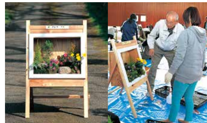
おしゃれなイーゼルガーデン作り

イーゼルガーデン作りをメインにした緑化講習会が3月20日、田舎の体験交流館さんがうらで開催されました。