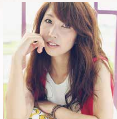
スペシャルゲスト