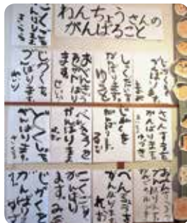
1年生になったら、こんなこと頑張ります