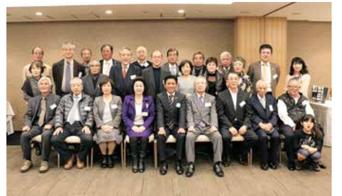
出席した会員の皆さん

なお、ことしで10年目を迎える関西カワセミ会では、10月のふれあいまつり“くまむら”に合わせて、里帰りツアーが実施される予定です。