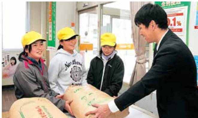
笑顔で棚田米を送る子どもたち

ことしで東日本大震災から5年を迎え、一勝地小学校では3月8日、本年度から取り組んだ「米づくりプロジェクト」で収穫した柳詰の棚田米 60kgを福島県の楡葉南小学校に支援米として送りました。支援米の中には、被災地の子どもたちが笑顔になるようにと、生徒の笑顔の写真やメッセージが添えられました。