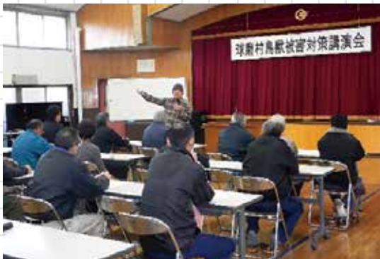
真剣に講演を聞く参加者