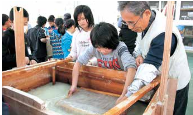
指導者の丁寧な指導で紙をすく

渡小4年生は2月24日、相良村四浦の四浦和紙工房で、和紙の原料となるコウゾを使い、紙すきを体験しました。