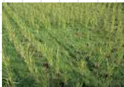
稲刈り後の二番穂