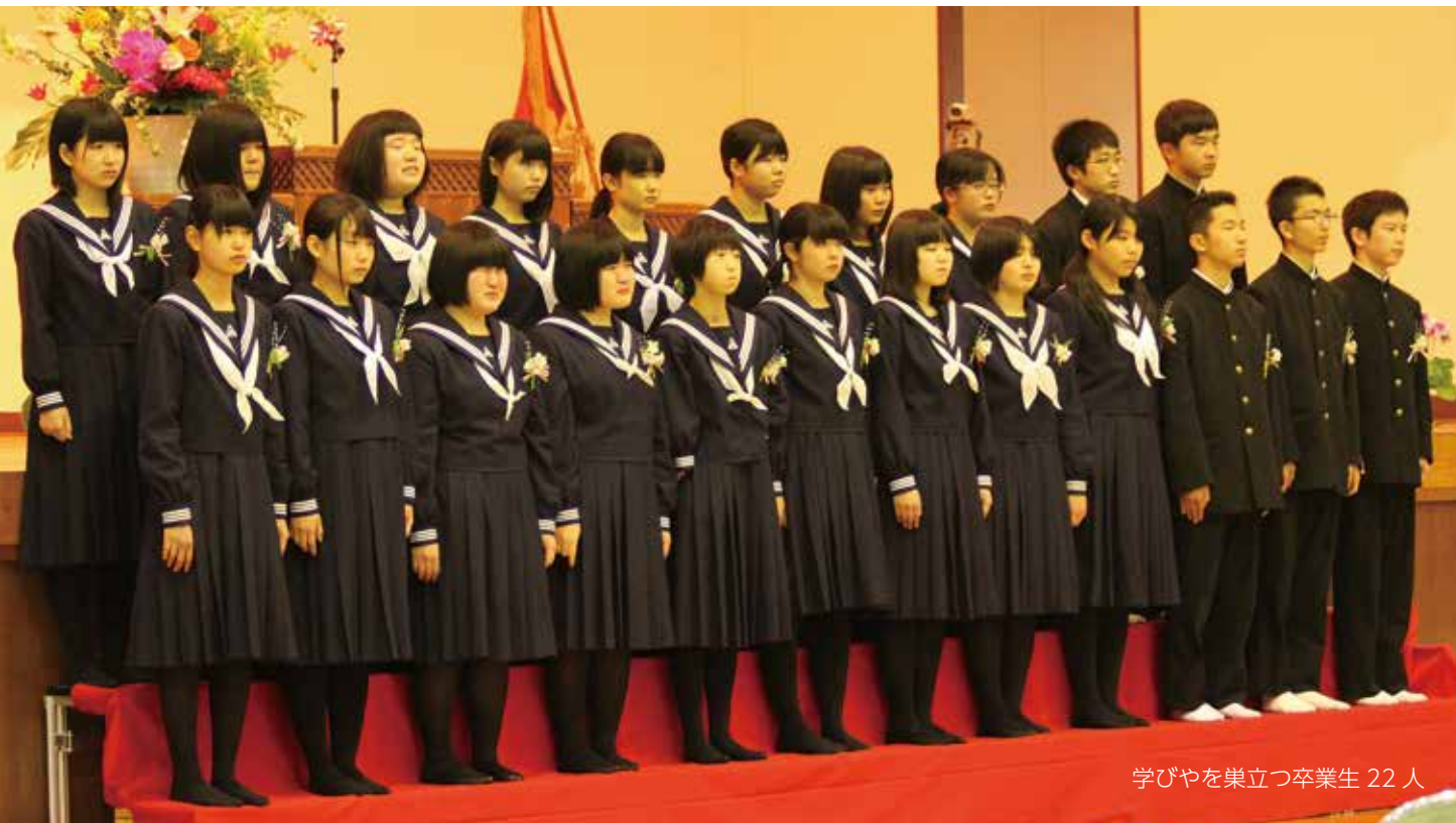
学びやを巣立つ卒業生 22 人