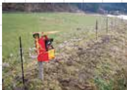
適切な設置、日々の管理により効果を発揮します

鳥獣被害対策に最も重要なのは、 集落ぐるみで協力して餌付けを止める ことです。地域住民全員で正しい対策を実践し、鳥獣害に強い地域づくりを目指しましょう。