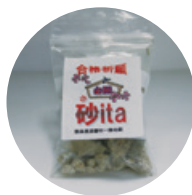
すべり防止砂 「砂 ita」