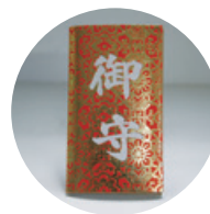
一勝寺お守り 「勝守」