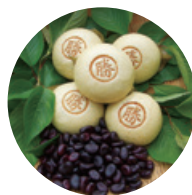
あじさい 「勝つ万十」