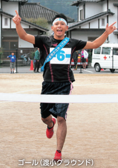
ゴール (渡小グラウンド)