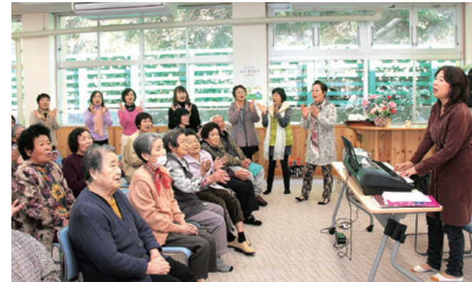
みんなで歌って楽しみました

くまむらふるさと“いきいき”大学では11月11日、神瀬福祉センターたかおとで、楽しく歌って心と体をリフレッシュする音楽教室を開催しました。