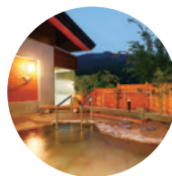
一勝地温泉 かわせみ