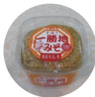
あじさい 「一勝地みそ」