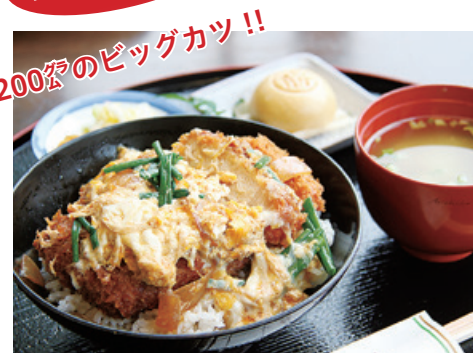
球泉洞 「必勝!! 森の勝つ丼」