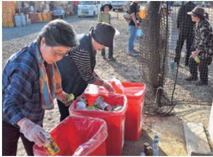
2日間、おつかれさまでした

ふれあまつり期間中は、村ボランティア連絡協議会の皆さんに、会場内のごみの片付けや、トイレの清掃を行っていただきました。おかげさまで、来場した皆さんにも気持ちよくふれあまつりを楽しんでいただけたことと思います。本当にありがとうございます。