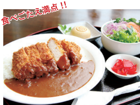
球泉洞 「必勝!! 森の勝つかレー」