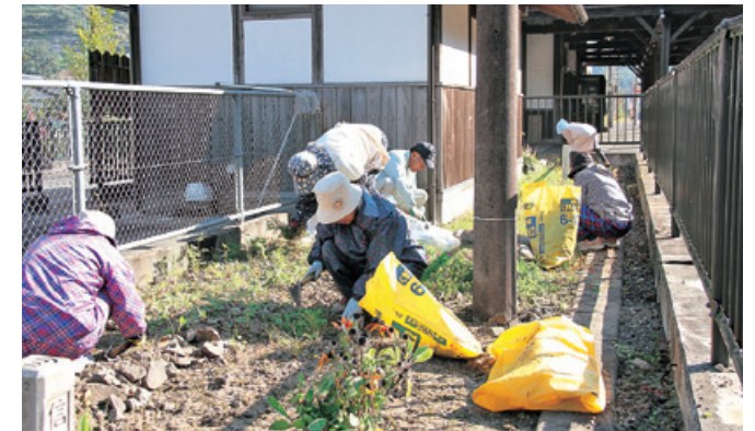
黙々と除草作業をすすめる会員の皆さん

清掃作業は、毎年10月第3土曜のシルバーの日に合わせて行われており、受験シーズンを前に、入場券などを買求めに来る人たちに、気持ち良く来ていただくために実施しました。会員の皆さんは、花壇の除草作業や草刈り機を使っの草払いなどをして汗を流しました。作業終了後は、一勝地温泉かわせみで健康教室も開催されました。