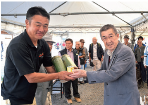
④球磨村文化協会から募金を贈呈していただきました

10月24・25日の2日間、ふれあいまつりくまむらが開催され、社会福祉協議会では、村ボランティア連絡協議会とボランティア協力校の小中学生に協力いただき、赤い羽根共同募金活動を行いました。ことしのまつりは、2日間とも晴天に恵まれたおかげで、たくさんの方々に協力をお願いすることができました。