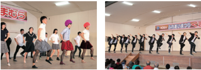
ダンスを披露！温かい拍手と声援をいただき、楽しく踊ることができました。