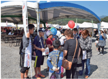
⑤村ボランティア連絡協議会とボランティア協力校の生徒による街頭募金