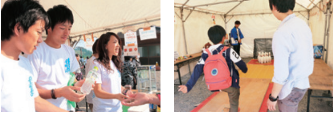
ジュースなどの販売とキックボーリングをして、たくさんの人にきていただきました。