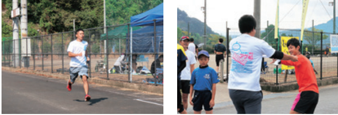
4年振りの参加！みんなで76.7*。走り切りました。