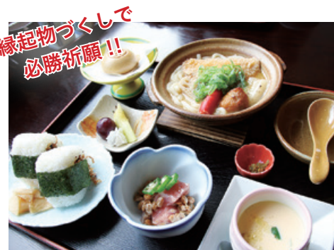
一勝地温泉かわせみ 「必勝御膳」