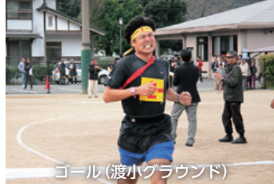
ゴール (渡小グラウンド)