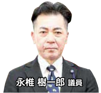
永椎 樹一郎 議員

村長 住み慣れた村を離れる方が増えている現状は村政における最優先かつ喫緊の課題、一刻の猶予も許されない。既成観念にとらわれない新しい取り組みが重要であると強く確信している。