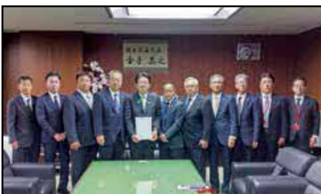
「金子国土交通大臣」への要望

球磨村簡易水道施設の老朽化施設の更新・耐震化など水道施設の整備に係る財政負担に対する補助制度の拡充を要望。