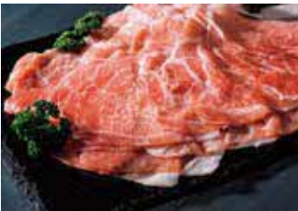
ふるさと納税返礼品 一勝地赤豚