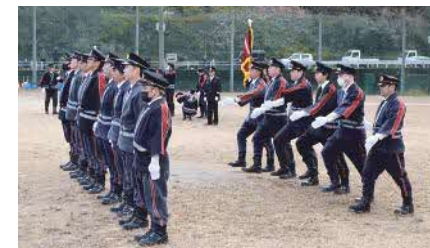
過去に行われた通常点検の様子