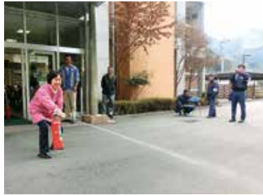
職員による消火器の初期消火訓練。まずは周囲に火事を知らせることが大切