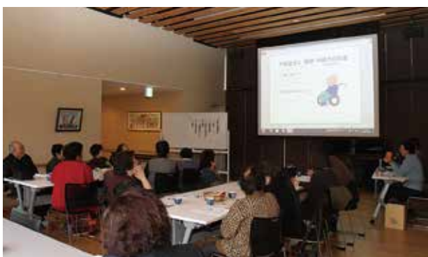
中瀬さんの経験を交えながら説明がありました

認知症を理解し、認知症の人を支えられるように11月28日、第1回家族介護教室が千寿園で開催されました。