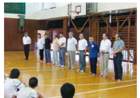
大瀬組郷土芸能保存会の皆さん