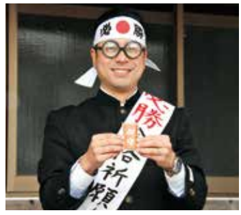
「勝つ守」を手に落ち着いて受験に挑みましょう

勝寺は黄檗宗の寺で、子どもの病気に霊験があるといわれる石造虚空蔵菩薩のほか、球磨郡では珍しい石造仁王立像が2体あります。仏様に供えた御守「勝つ守」(400円)は、勝負の前に緊張する皆さんを落ち着かせてくれます。