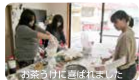
お茶うけに言われました

<大根のバリバリ漬け作り> ざらめや薄口、濃口しょう油を使って、大根の漬物を作りました。