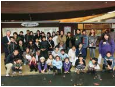
天気の悪い中参加いただき、ありがとうございました