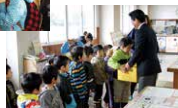
役場を訪れた園児たち