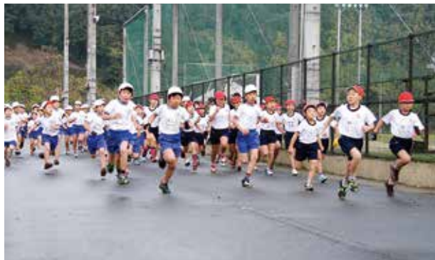
勢いよくスタートする子どもたち

子どもたちは、この日までに体育の授業や部活動を通して一生懸命に練習を積み重ねてきました。本番では、一人一人目標を掲げ、少しでもベストの記録に近づけるよう走り抜きました。また沿道には、たくさんの保護者や地域の人が駆け付けて応援し、子どもたちの頑張る姿を見届けていました。