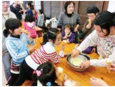
出来上がったミルクアイスは、濃厚な牛乳の味がしました