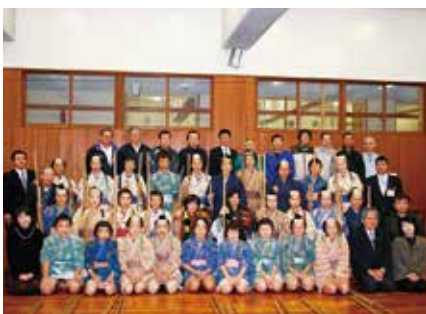
発表会後の集合写真

生徒たちは、この文政三年棒踊りに触れることにより、郷土を知り、故郷を愛する心を養うきっかけと、学年の団結力を高める貴重な機会を得ることができました。