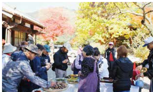
一勝寺の紅葉とおいしいおもてなし

参加者の皆さんは、観光案内人の説明を受けたり、球磨川沿いの風景を見たりしながら、秋の球磨村を楽しみました。また、淋地区と一勝寺には、臨時茶屋もオープンし、地域のお母さん手作りの漬物や、球磨村農産加工グループで作られている柚餅子などが振る舞われ、参加者は足を休めていました。