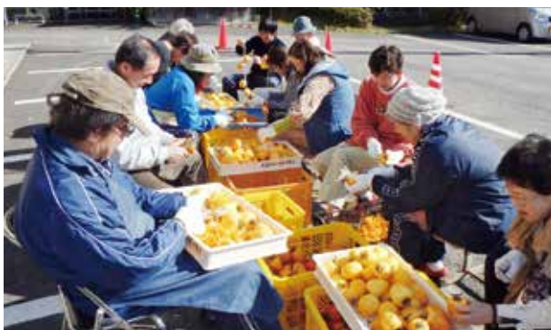
一つ一つ皮をむくのは一苦労

田舎の体験交流館「さんがうら」では11月24日、つるし柿作り体験が行われました。