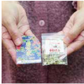
JR一勝地駅で販売されている「入場券」と「砂ita」