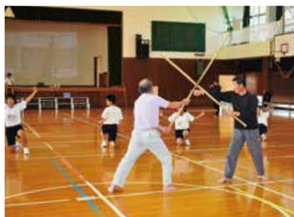
保存会の皆さんと生徒の練習風景