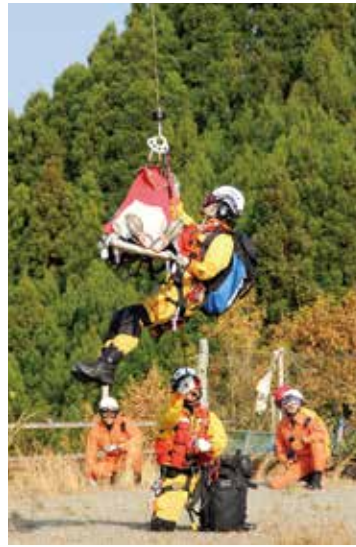
松谷地区での赤バイ投入訓練⑤／高沢地区での救助訓練⑥

人吉盆地南縁断層を震源とする直下型地震が発生し、孤立地域が発生したことを想定して12月4日、高沢地区と松谷地区で実動訓練が実施されました。