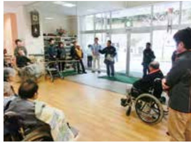
寒い中、避難訓練にご協力いただきありがとうございました