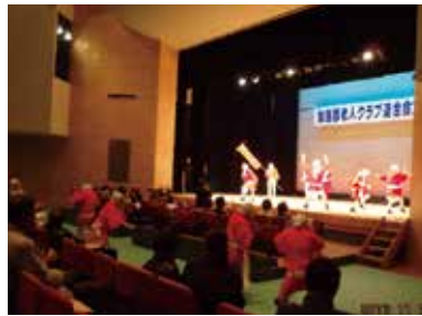
おすてこ一座のひょっとこ踊りは、会場を盛り上げました