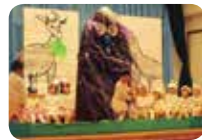
劇：さんびきのやぎの がらがらどん