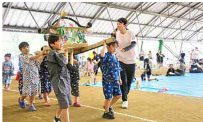
会場を盛り上げました