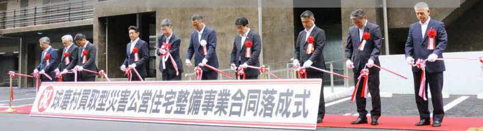
令和5年9月に行われた、球磨村買取型災害公営住宅整備事業合同落成式