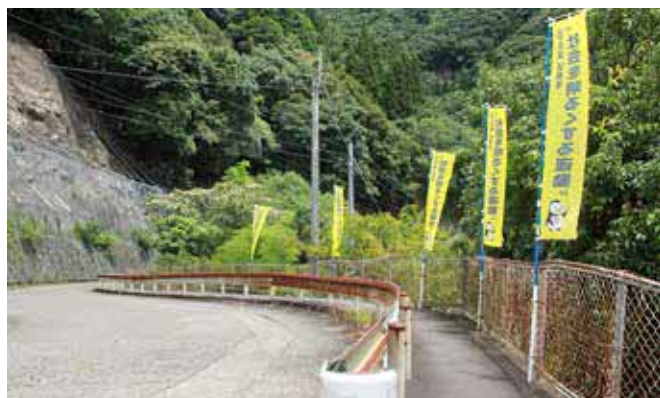
役場への上り坂に設置しています

人吉地区保護司会では、7月の「社会を明るくする運動」月間に合わせ、啓発活動の一環で、法務大臣の委嘱を受けた球磨村の保護司が、のぼり旗を設置しました。この運動は、「犯罪や非行を防止し、安全で安心して暮らすことのできる明るい地域社会を築くこと」や「犯罪や非行をした人が再び犯罪や非行を行わないように、その立ち直りを支えること」を目標としています。