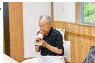
▲ 拡声器の点検をしました