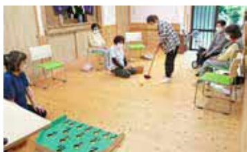
▲ 100点を狙い、一打を放ちます

ゲートボールでは、点数が書かれた穴に狙いを定めて、ボールを打ちました。思い通りにいかず苦戦しましたが、楽しく体を動かすことができました。