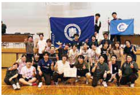
▲ 汗を流しながら頑張りました

ことしも山江村青年団と合同で参加し、各競技で熱戦を繰り広げ見事、総合2位に輝くことができました。来年こそは優勝できるよう、青年団全員でトレーニングに励んでいこうと思います。