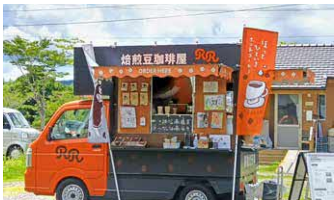
美味しいコーヒーをありがとうございます

7月7日、サントリーホールディングス株式会社の移動焙煎車が別府峯住宅（旧芝生広場）にやってきました。