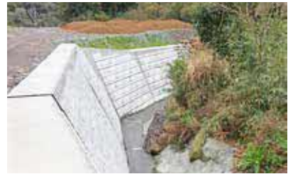
▲ 山ノ神谷川 (毎床班)