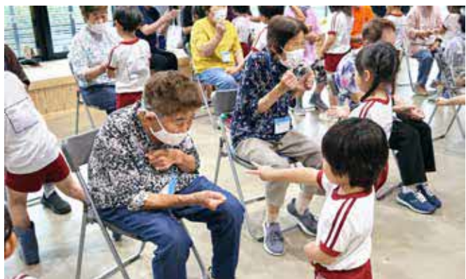
じゃんけん対決もしました

渡ニコニコ会・ミドリ会のふれあいサロン参加者17人と渡保育園の3～5歳児の20人が村営住宅エスペランサ桜峯で交流しました。