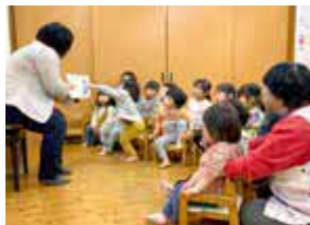
「おにゃんこタクシー」