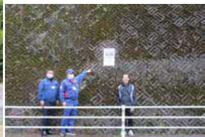
▲ 県道高沢一勝地線入口（中園班）