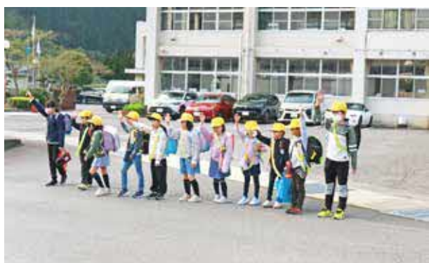
▲ お兄さんお姉さんたちと一緒に初登校