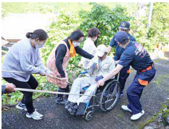
▲ 令和5年度 要支援者搬送訓練