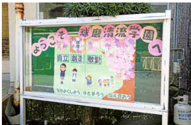
▲ 新入生を出迎えます