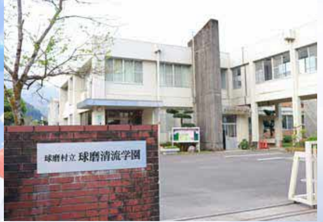
▲ 新たな学び舎となる球磨清流学園南校舎