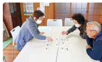
▲次につながる単語を探します

また、花粉症の症状や治療について話がありました。冷たい食べ物や甘い食べ物、肝臓に負担をかける食材を控えることで、対策をしていきたいと思えます。