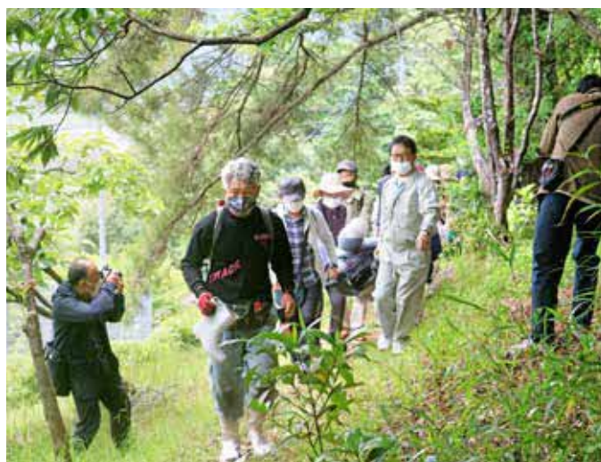
▲ 令和4年度 合同避難訓練