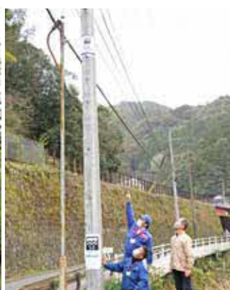
▲ 友尻班下流側広場