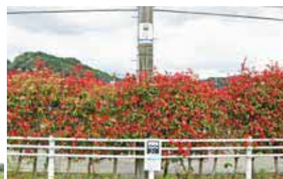
▲ 一王子団地前（山口班）