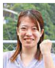
▲ 青年団 Instagram