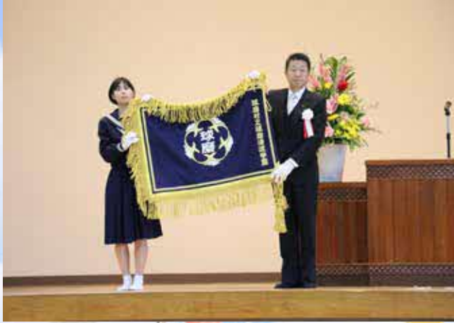
▲ 校旗が村から学校へと授与されました