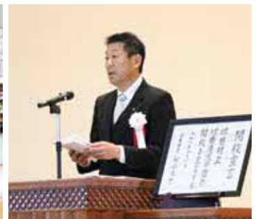
▲ あいさつをする村山校長