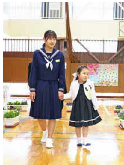
▲ 9年生と一緒に入場する新入生