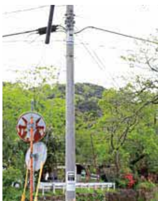
▲ 旧渡小学校前（小川班）