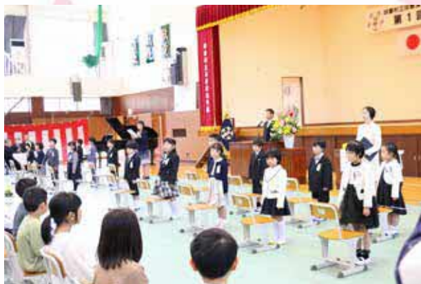
▲ 氏名を呼ばれ、大きな声で返事する新入生