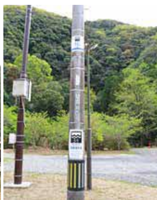
▲ 熊野座神社（堤岩戸班）