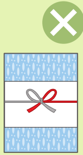
お歳暮・お年賀など