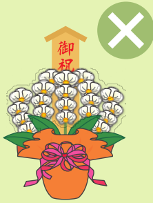
落成式・開店祝などの祝花、 葬儀の供花、病気見舞いなど