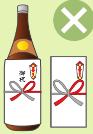
お祭りへの寄附・差し入れ、町 内会の集会・旅行などの催物へ の寸志・飲食物の差し入れ

※政治家本人が結婚披露宴、葬式などに自ら出席してその場で行う場合には、 罰則が適用されない場合があります。