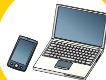
インターネット・ 気象庁ホームページ