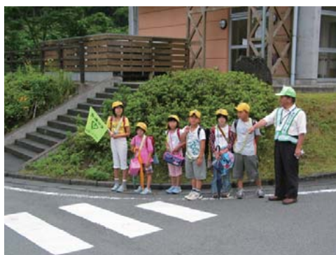
地域のパトロールの様子