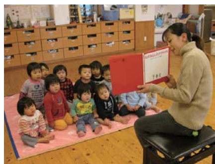
絵本の読み聞かせの様子