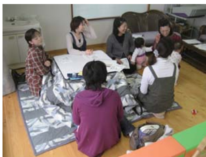
母親同士の交流の場の様子 (子育て支援センター)